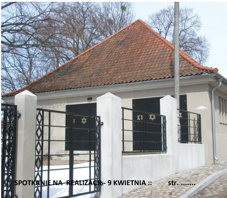
SPOTKANIE NA REALIZACJI- 9 KWIETNIA :: str. ....